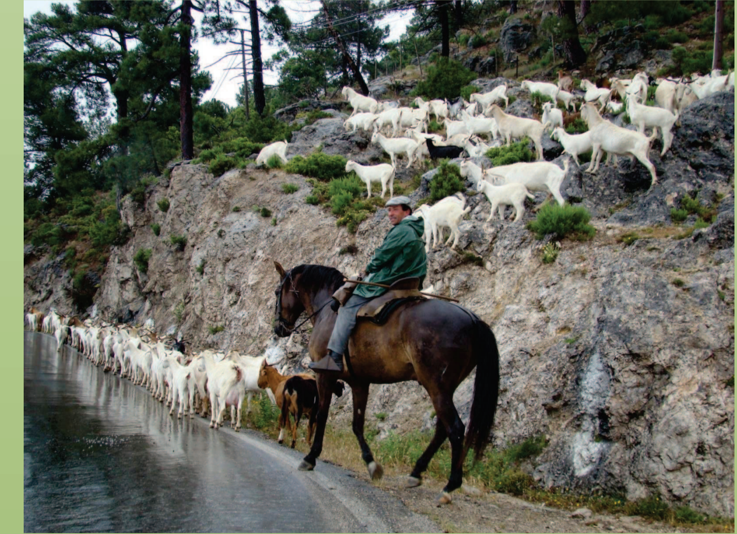
Figura 3: Trashumancia de la raza Blanca Andaluza regresando a los pastos de verano. Puerto de las Palomas