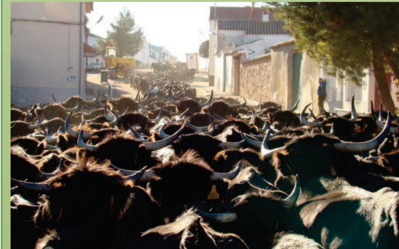
Figura 4: Bovino de lidia procedente de Teruel pasando por el municipio de Viveros hacia las dehesas de Vilches