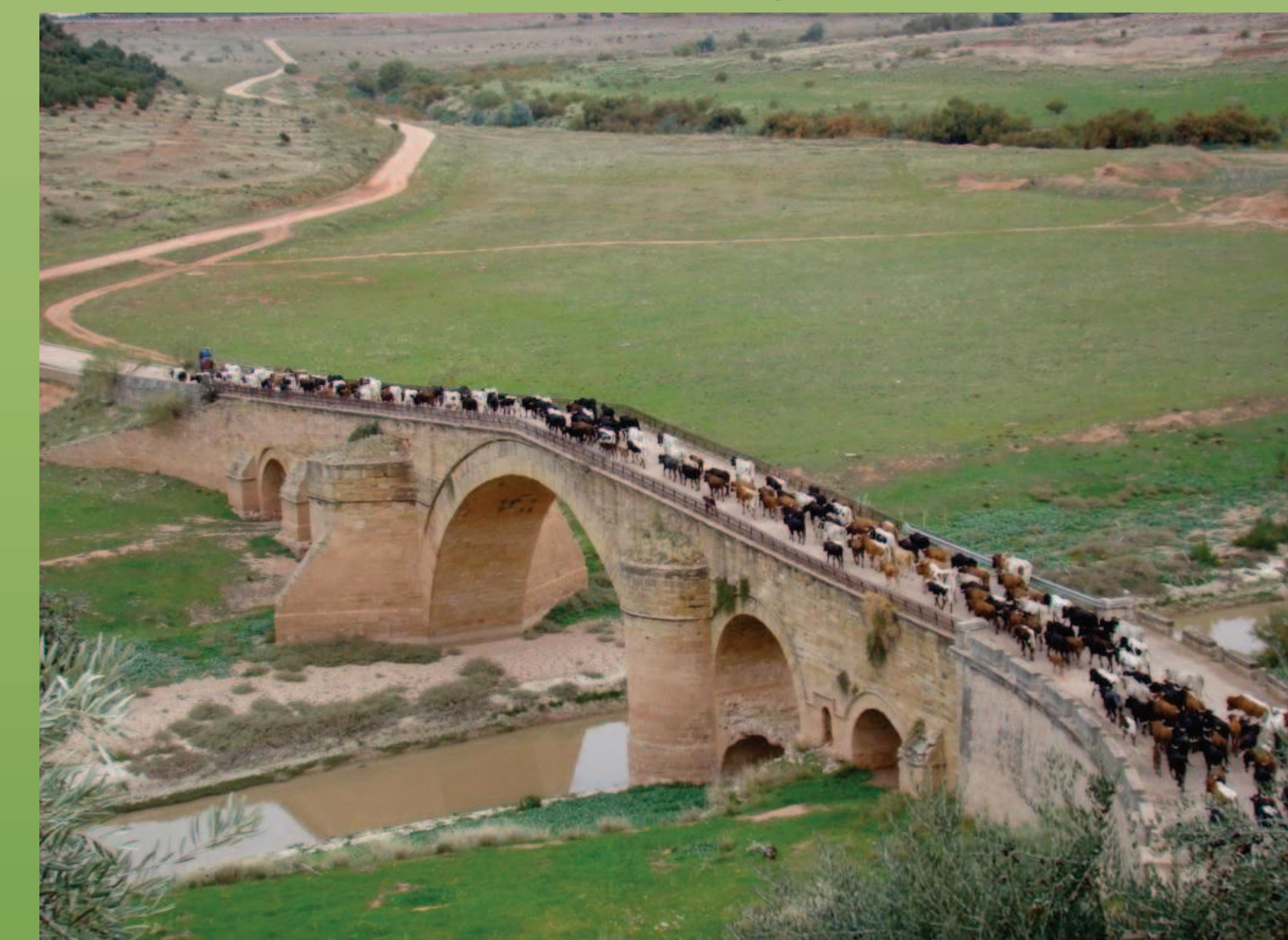
Figura 6: Ovino Segureño cruzando el Puente Romano de Puertolaca